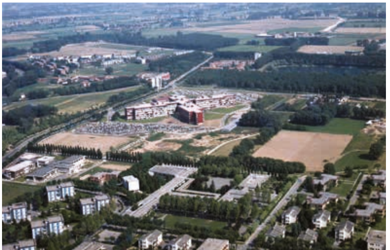
Una vista della città nel periodo tra la realizzazione del Terzo e del Quarto palazzo uffici

Passarono gli anni e nel primo decennio del nuovo secolo, venne eretto il "Sesto" . La sua dimensione volumetrica, che appare sproporzionata rispetto al contesto, occupò il primo lotto di terreno acquistato da SNAM nel 1951. Un tentativo ancora incerto di riavvicinarsi alla propria origine che contribuì alla rinascita della Nazione.