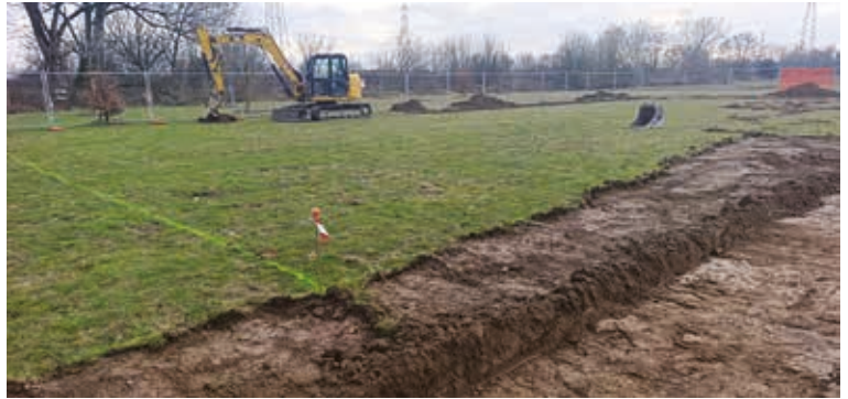
L'area di cantiere dove sorgerà il nuovo campo da gioco di Poasco

Avviato a febbraio l'intervento per la realizzazione di un campo polivalente di basket e calcetto